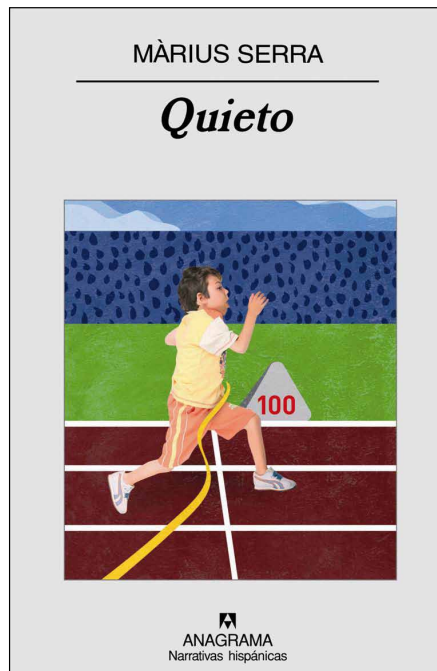
Màrius Serra: Quieto Barcelona: Anagrama, 2008

Aquest és un article escrit des de la parcialitat més objectiva. Començaré, doncs, posant algunes cartes sobre la taula.